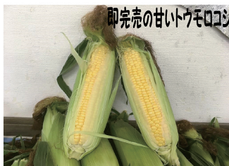
即売の甘いトウモロコシ