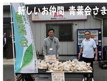
今が旬のびわです

6月の一押しは、粒がしっかりした甘あ〜いトウモロコシと枝豆 ちょうど当日は父の日でしたので、毎日家族のために 一生懸命に頑張ってるお父さんに、冷たいビールと枝豆がピッタリ 色とりどりのトマトに、ツヤツヤのナス キュウリは3本で100円 シイタケにマッシュルーム キャベツに大根にズッキーニ 小玉スイカに、大人気のアンデスメロンは茨城県の名産です 6月から新しいお仲間が増えましたよ 社会福祉法人青葉会さんからは 大きなジャガイモが届きました お買い得な価格で大人気でした たくさんのお客様にお出で頂き、有難うございました ますます皆さんに喜んで頂けるよう頑張りますので、お楽しみにお待下さいね ♡