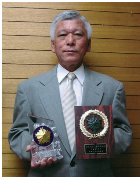
受賞者の右手が京都府警察本部刑事部長感謝状 (平成9年12月) 左手が南消防署署長からの感謝状 (平成9年3月)