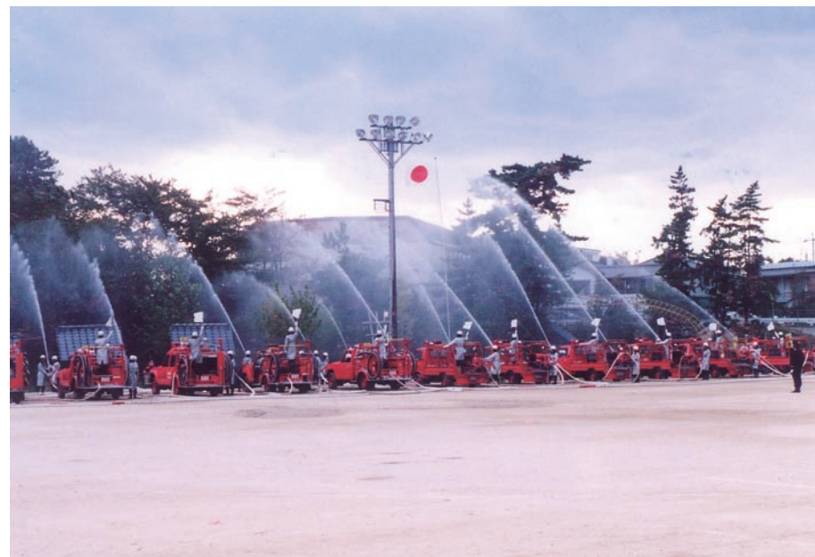
受賞者の指揮(右端)による放水訓練