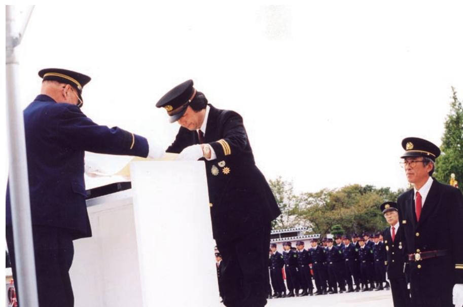
岡崎市長から表彰を受ける受賞者(平成11年10月17日)