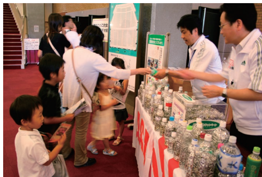
イベント会場でプルトップを手渡す読者