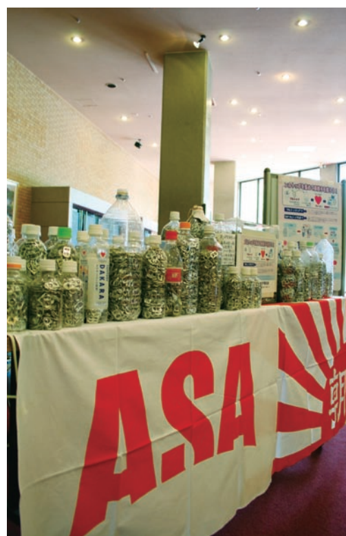
イベント会場で回収されたプルトップ