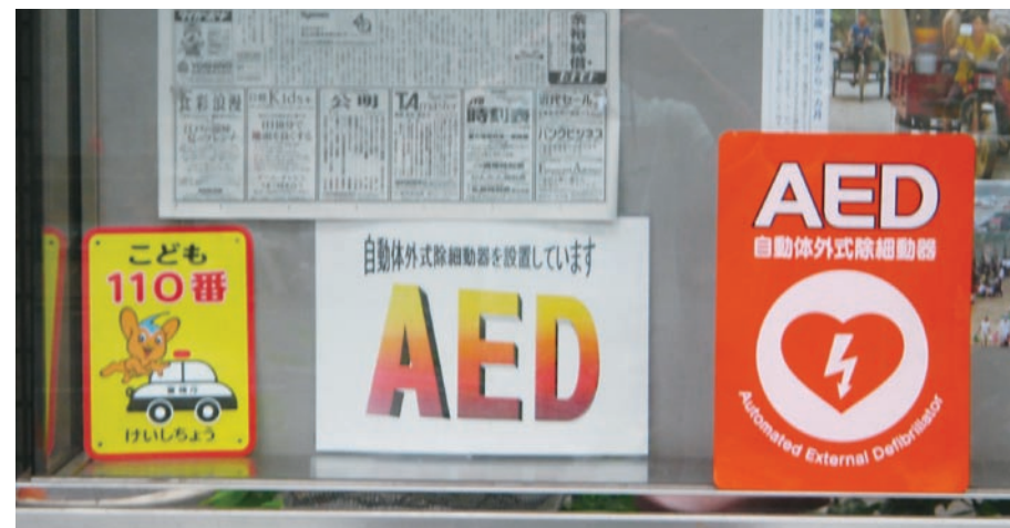
「AED」設置を示す店外掲示板