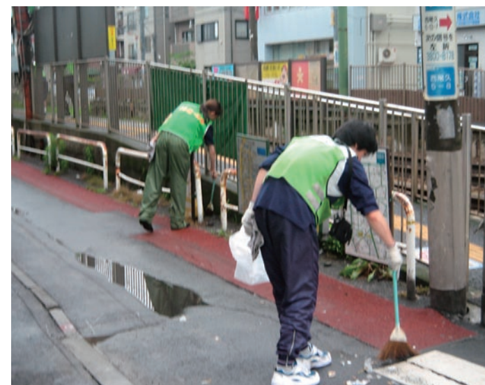
駅周辺の清掃活動の様子